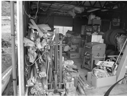
詰め放題の工場附属建屋

不要・不急な物品を屋外に搬出し、区分。 本当に不必要なモノは、廃棄。 不急品は、倉庫にて期限付き保管。